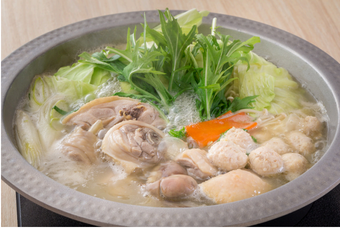
博多名物~水 炊鍋套餐