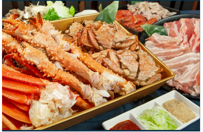
三大蟹鍋物吃 到飽酒水暢飲