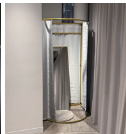
フィッティングルーム 2 個