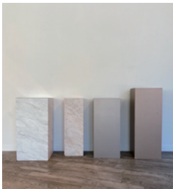
ディスプレイボックス x 4