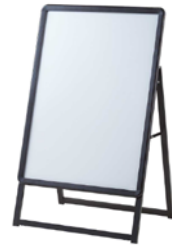
ポスタースタンド (A1片面縦)