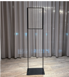
ボードスタンド (A3 縦)