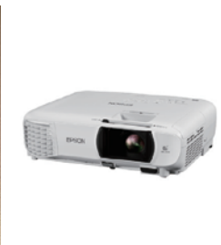
EPSON EH-TW60 天付