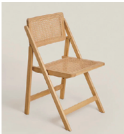
椅子 x 2 脚