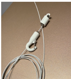
白壁用ピクチャーワイヤー