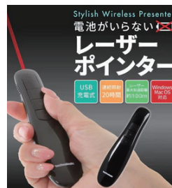
レーザーポインター 1 個