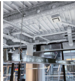
吊り式ハンガーラック (1.5mx7本)