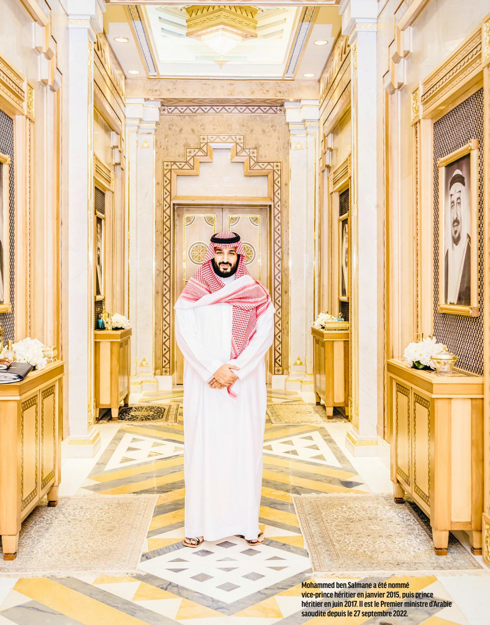
Mohammed ben Salmane a été nommé vice-prince héritier en janvier 2015, puis prince héritier en juin 2017. Il est le Premier ministre d'Arabie saoudite depuis le 27 septembre 2022.