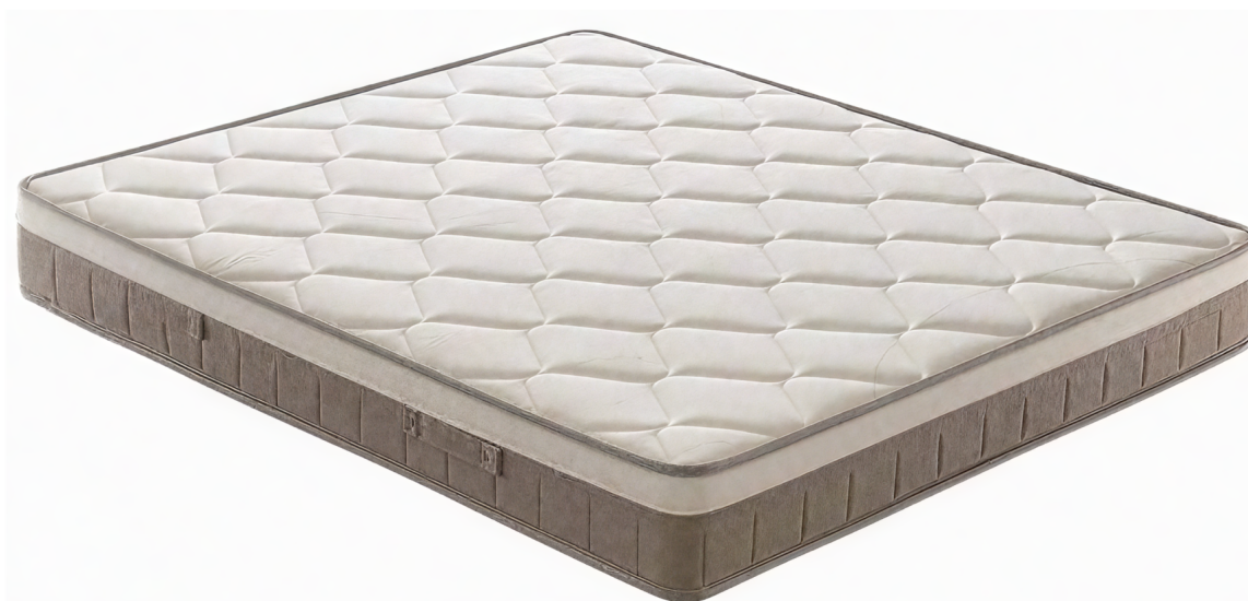
Materasso Iris – Vista prospettica principale

Via dell'Industria, Siderno (RC) · www.ildormire.com