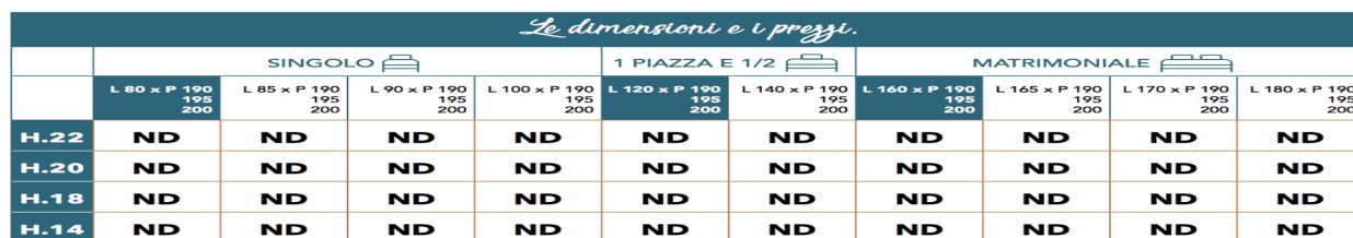
Tabella Dimensioni e Misure Disponibili